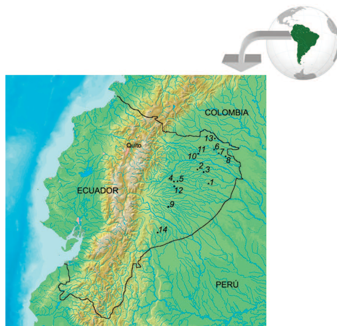
Figura 1. Localización en Ecuador de los lugares considerados en este estudio. Los números de cada localidad se refieren a los registros de cacería descritos en la Tabla 1 .

Se realizaron análisis de correlación entre la biomasa cosechada diaria per capita de todas las especies y la antigüedad de las distintas localidades y la densidad humana en el área de caza, para evaluar la influencia de la persistencia e intensidad de cacería en la cantidad de carne de monte cosechada. También se correla-