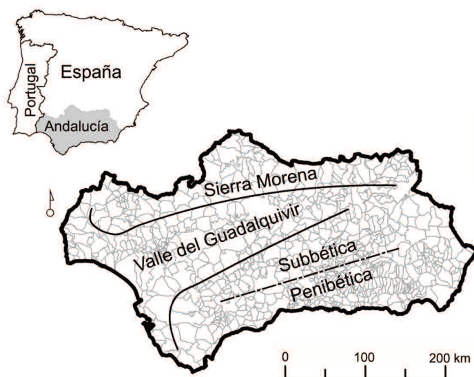
Figura 1. Localización del área de estudio, Andalucía, destacando la ubicación de los principales sistemas montañosos y del valle del Guadalquivir (adaptada de Acevedo et al. 2011).

Los cultivos herbáceos en regadío se incrementaron en un 181 % en el área y periodo de estudio, al mismo tiempo que los cultivos herbáceos en secano vieron reducida su extensión al 62 % de la que ocupaban en los 60s (Junta de Andalucía 2009). De la superficie perdida de cultivos herbáceos en secano, el 58 % fue transformada en cultivos leñosos, también en secano, y el 23 % a cultivos en regadío; estos cambios se produjeron principalmente en el valle del Guadalquivir. Sin embargo, en las zonas de montaña las parcelas que se cultivaban en secano en los 60s fueron abandonadas (suponen el 12 % de la superficie transformada) y se convirtieron en pastizales y parcelas de matorral (Gargano et al. 2012). Se ha producido, por tanto, una intensificación de la agricultura en las