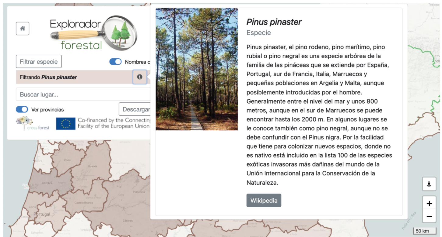
Figura 2. Captura de pantalla de la interfaz de usuario del Explorador Forestal en la que se muestra una ventana emergente con información de la especie Pinus pinaster proveniente de la DBpedia (imagen, descripción textual y enlace a la Wikipedia), ilustrando así el uso de datos abiertos enlazados.