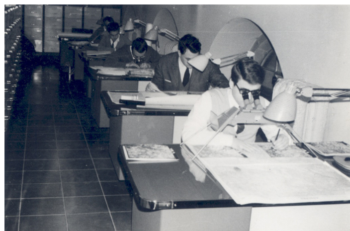
Figura 1. Utilización de Fotografías aéreas y técnicas estereoscópicas en el IFN1. Parcelas variables, con el Relascope de Bitterlich, se seleccionaban los árboles en función de su diámetro y su distancia al centro de la parcela.

Figure 1. Using aerial photographs and stereoscopic techniques in NF11. Angle count plots where trees were selected according to their diameter and its distance from the center of the plot.