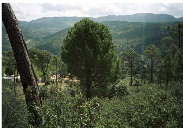
Figura 3. Fotografías tomadas en la misma localización de una parcela en el IFN4 (izquierda) y en el IFN3 (derecha) que nos permiten analizar la evolución de la masa forestal.

Figure 3. Plot photographs taken at the same location in the IFN4 (left) and IFN3 (right) allowing us to analyze the evolution of the forest.