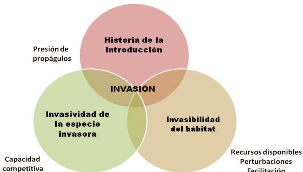
Figura 2. Esquema teórico de los factores que influyen en el proceso de invasión: invasividad de la especie invasora; la invasibilidad o susceptibilidad del hábitat receptor a ser invadido y la historia de la introducción de la especie invasora.

La presente tesis doctoral ha sido financiada por las encomiendas de gestión entre el MAGRAMA y el INIA-CIFOR, AEG-09-007 y EG-13-072, y el proyecto de Plan Nacional de I+D+i, AGL2010.21153.